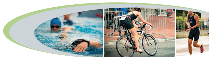
Impressionen aus den vergangenen Jahren

Buntes Rahmenprogramm Ausstellung diverser Händler